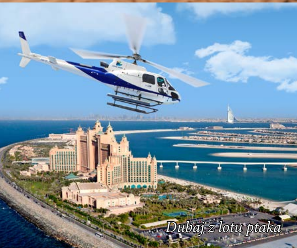
Dubaj z lotu ptaka