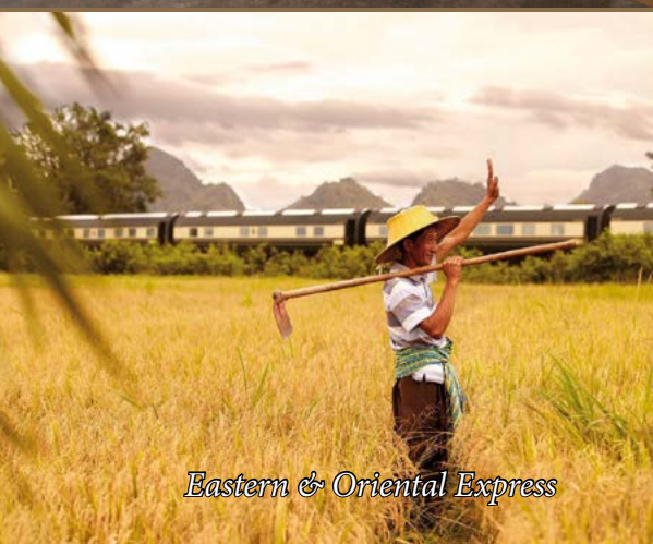
Eastern & Oriental Express