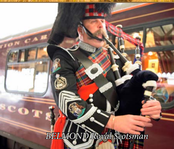
BELMOND Royal Scotsman

Luxury Travel Management Sp. z o.o. posiada LICENCJĘ nr 756 dla organizatorów turystyki, wydaną przez wojewodę mazowieckiego, oraz POLISĘ UBEZPIECZENIOWĄ Signal Iduna nr M 206153, na sumę gwarancyjną 2 376 000,00 zł , czyli umowę ubezpieczenia kosztów powrotu klientów do kraju, a także zwrotu wpłat wniesionych przez klientów za imprezę turystyczną. Ceny zamieszczone w niniejszym katalogu są orientacyjne i mogą ulec zmianie z przyczyn niezależnych od Luxury Travel.