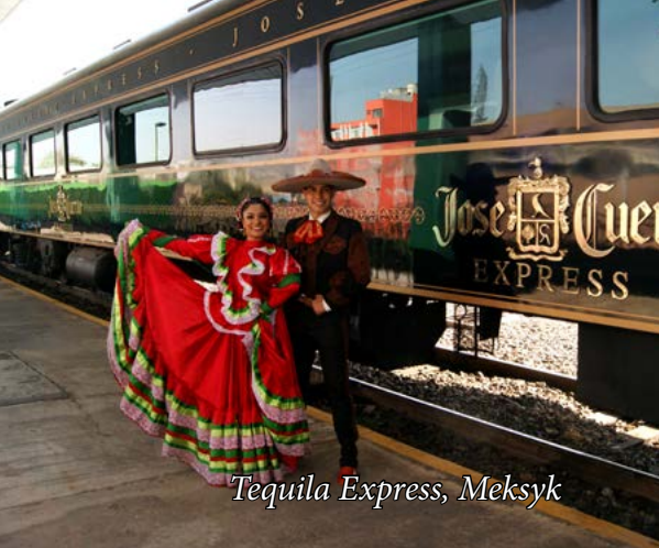
Tequila Express, Meksyk