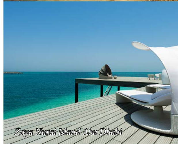
Zaya Nurai Island Abu Dhabi