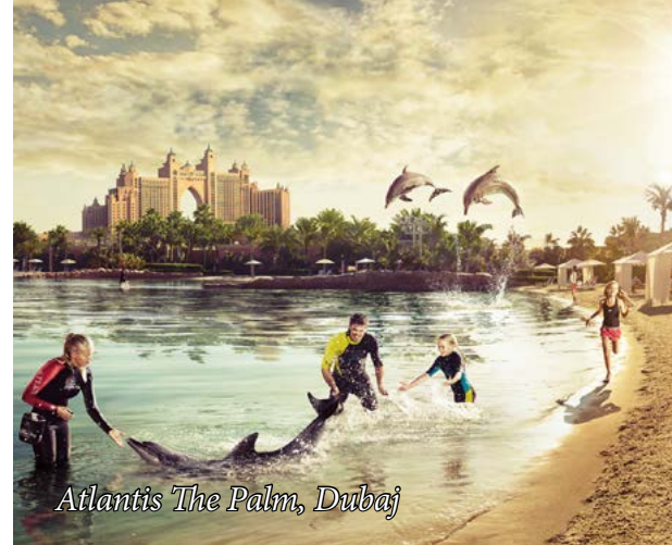
Atlantis The Palm, Dubaj

Tel: 22 392 60 16/19 | ltm@luxurytravel.pl