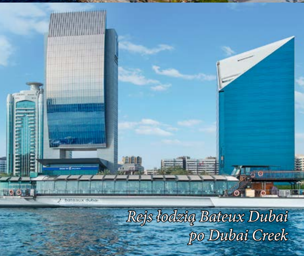
Rejs łodzią Bateaux Dubai po Dubai Creek