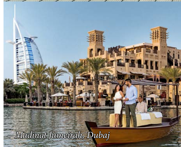
Madinat Jumeirah, Dubaj