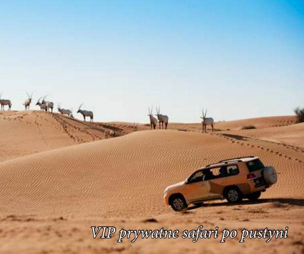
VIP prywatne safari po pustyni